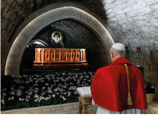
Leo XIV. im stillen Gebet vor dem Grab des Nationalheiligen Charbel Machlouf.