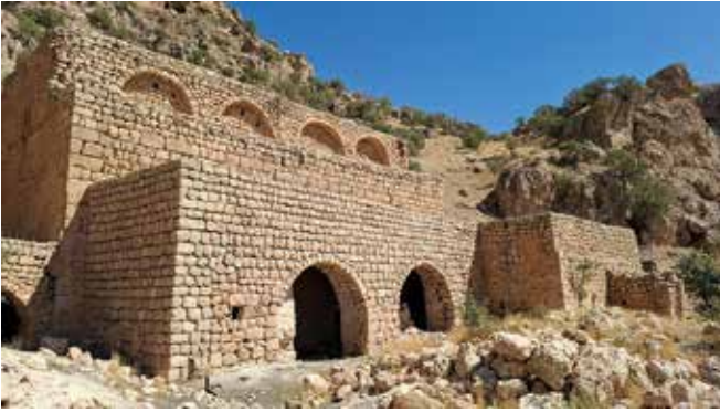
Die Reste des Abraham-Klosters, die sich in einem noch recht guten Zustand befinden.