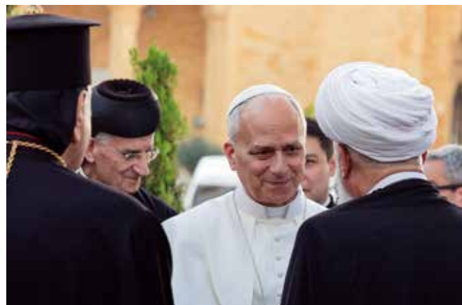
Dialog und Begegnung: Der Papst traf zahlreiche Vertreter verschiedener Kirchen und Religionen.

Montagfrüh besuchte Leo das Saint-Maroun-Kloster in Annaya. Dort betete das Kirchenoberhaupt am Grab des libanesischen Nationalheiligen, des wundertätigen Mönchs Charbel (1828-1898), der auch von Gläubigen anderer Religionen verehrt wird. Vor dem Kloster harrten bei Wind und Regen wieder zahlreiche Menschen aus, schwenkten libanesische und vatikanische Flaggen und jubelten dem Papst zu. Sein Gastgeschenk an das Kloster, eine Lampe, solle dem Libanon helfen, „stets im Licht Christi zu wandeln“, sagte der Papst.