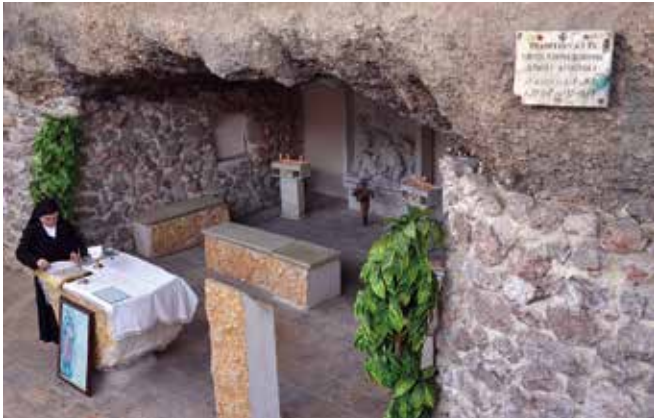
Diese Kapelle im Franziskanerkloster in Damaskus soll sich an jener Stelle befinden ...

vielen Landesteilen – insbesondere im Norden und Süden – habe die Regierung jedoch noch keine Kontrolle. Die entscheidenden Fragen lauten: „Ist al-Scharaa ernsthaft daran interessiert, demokratische Reformen voranzutreiben und sicherzustellen, dass Minderheiten im politischen System vertreten sind?“ Das Wichtigste für die Regierung sei: „Sie braucht das Vertrauen der Menschen.“