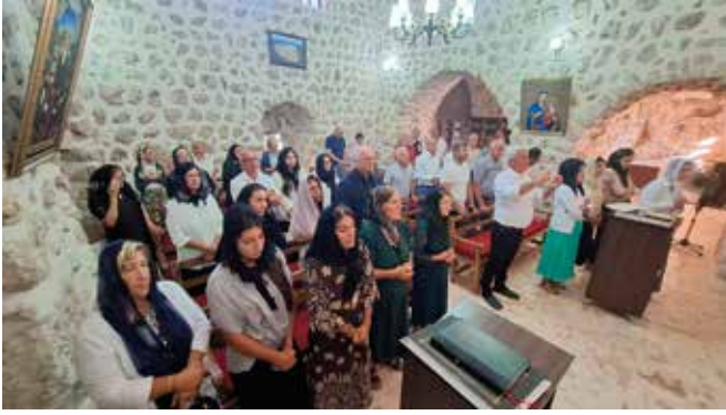
Die Bewohner:innen von Badibe feiern Sonntagsgottesdienst im Kloster Mor Yakub d'Karno.

auch an ihren eigenen Häusern nichts renovieren dürfen bzw. Neubauten nicht möglich seien. Auch in solchen Fällen ist der Rechtsanwalt aktiv, der selbst seine Wurzeln im Turabdin hat. Er bemüht sich auch darum, dass die extrem langen Gerichtsverfahren in der Türkei beschleunigt werden.