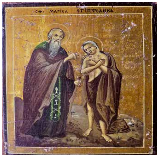
Maria empfängt vom Mönch Zosimas die Kommunion. (Ikone, 19. Jahrhundert)

Beim Verlassen der Kirche verspürte sie den Ruf, den Jordan zu überqueren, um in der Wüste Ruhe zu finden. Als ihr ein Fremder drei Münzen schenkte, kaufte sie dafür drei Brote und erreichte bei Sonnenuntergang die Kirche von Johannes dem Täufer am Jordan. Nachdem sie Gesicht und Hände im heiligen Wasser gewaschen, die heiligen Sakramente empfangen und die Hälfte eines ihrer Brote gegessen hatte, schlief sie auf dem Boden.