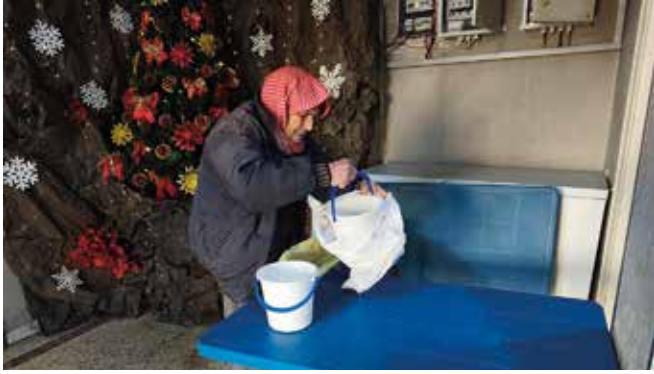
Für viele Menschen in Not ist die Suppenküche der Franziskaner die letzte Rettung.

wieder mehr Menschen in Not mit warmen Mahlzeiten versorgen muss. Auch im örtlichen Kloster der Franziskanerinnen fanden viele Familien Aufnahme, die nun weitere Unterstützung brauchen.