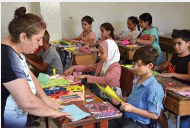
Eine von „People of Mercy“ geführte Schule für Flüchtlingskinder in Damaskus.