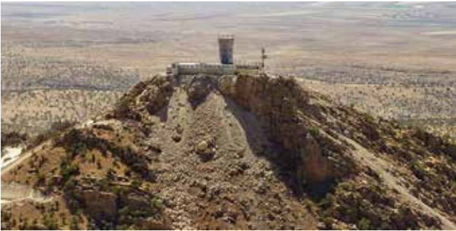
Rund um das Kloster sieht man zahlreiche Militäranlagen. Ganz im Hintergrund liegt schon Syrien.

chen Militärposten vorbei, die die gesamte Gegend – früher auch ein Rückzugsort der PKK – genau überwachen.