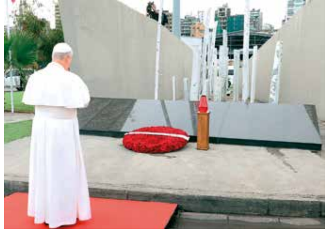
Im Hafen von Beirut: Leo beim Mahnmal für die Opfer der Explosionskatastrophe.

Ein großer Gottesdienst in Beirut mit 150.000 Teilnehmenden war der bewegende Abschluss der Reise. Leos letzte Worte, mit denen er sich von den Menschen verabschiedete, waren: „Libanon, steh wieder auf! Sei ein Haus der Gerechtigkeit und der Geschwisterlichkeit! Sei ein Vorbote des Friedens für die ganze Levante!“.