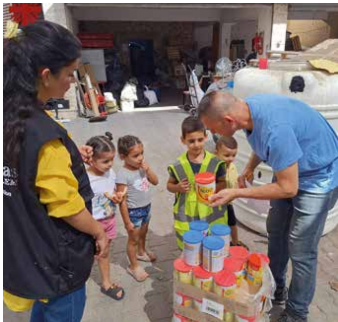
Die Caritas verteilt Lebensmittel in Gaza. Auch Milchpulver für Kinder ist dabei.