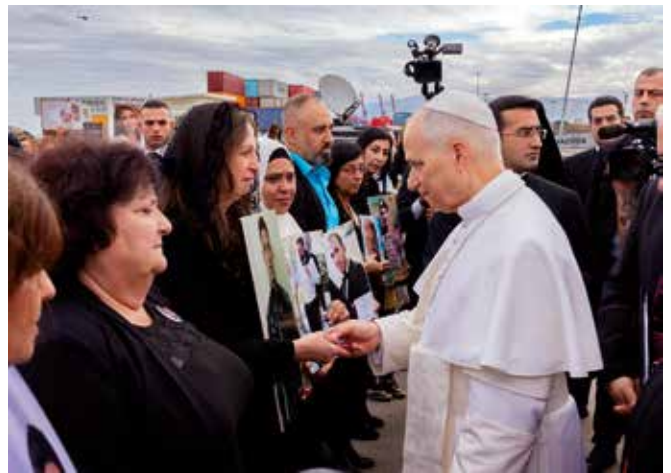
Ein berührender Höhepunkt des Besuchs: Leo trifft Angehörige der Opfer der Explosionskatastrophe.